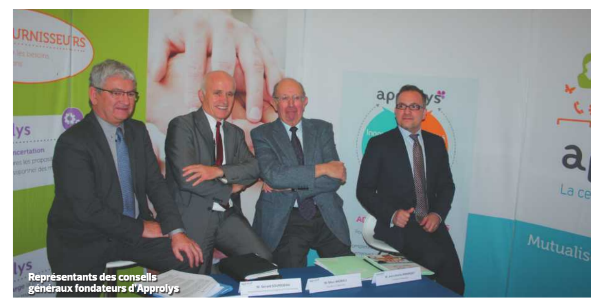
Représentants des conseils généraux fondateurs d'Approlys