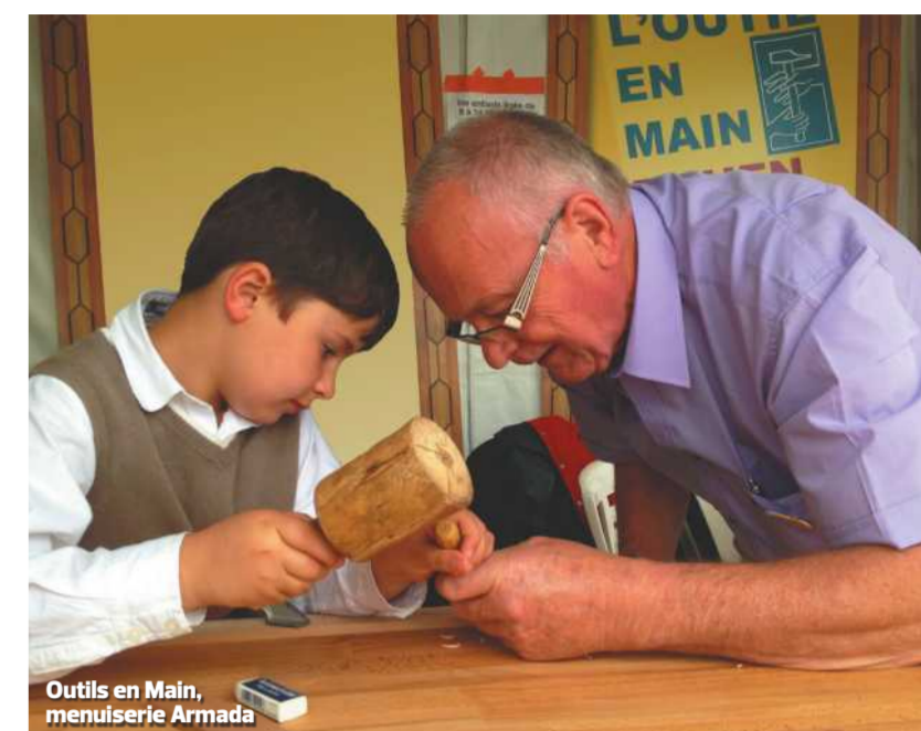
Outils en Main, menuiserie Armada

Autre exemple d'insertion sociale, celle de la société iséroise Alyl Sécurité, spécialisée dans la sécurité incendie. Lauréate du Grand Prix, cette entreprise vend des packs de services pour la sécurité incendie (audit, installation d'appareils et service après-vente). Mais ce n'est pas tout : au vu de sa croissance, la société a surtout fait le choix de ne recruter que des gens au chômage ou victimes de discriminations que l'entreprise forme à 100%. Et cela fonctionne : pour 2016, Alyl Sécurité a prévu de recruter en pays de Savoie, Drôme, Ardèche et Isère. Outre les initiatives locales, de grandes structures ont elles aussi misé sur l'insertion sociale. Le pari d'Adecco Insertion : démontrer qu'embaucher des handicapés en travail partiel est un atout pour la production et même pour la productivité. Adecco a ainsi créé le premier réseau national d'insertion.