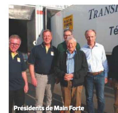
Présidents de Main Forte