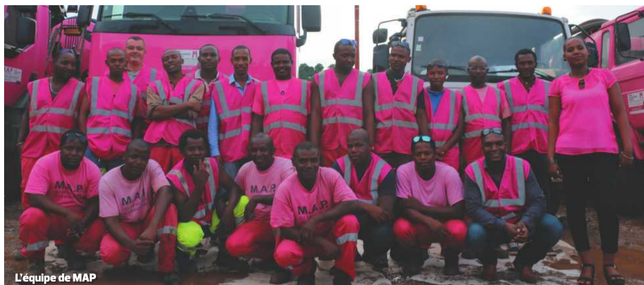
L'équipe de MAP

Parmi ces Bonnes Nouvelles des Territoires, des entrepreneurs ont mis leurs actions au service du recyclage ou de l'économie d'énergie. Terraotherme, Phénix et MAP sont trois exemples concrets qui ont su apporter des solutions innovantes en faveur de l'environnement. Explications.